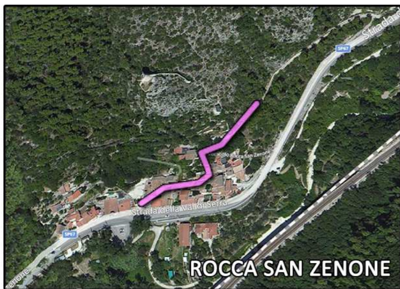
ROCCA SAN ZENONE